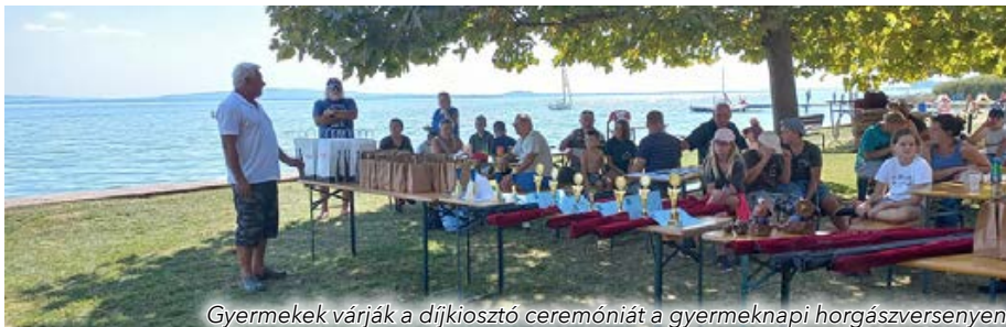
Gyermekek várják a díjkiosztó ceremóniát a gyermeknapi horgászversenyen

A rendszerváltozást követően nagy divatja lett a közösségi élet demokratikus alapokon történő újjászervezésének. A '90-es éveknek ebben a termékeny időszakában hívták életre elődeink a nyugdíjas klubot, a futballklubot, a színjátszó kört, és ekkor szerveződött meg településünkön a hegyközség, a kézilabdacsapat, valamint a polgárórság is. Ezeknek a közösségi egyesületeknek, civil kezdeményezéseknek a sorába illeszkedett 1994-ben a Balatonszepezdi Arany Horog Horgászegyesület is, amely nem is olyan régen, 2019-ben ünnepelte alapításának 25. jubileumát. Ez a történelmi léptékkal is mérhető negyed évszázad pedig feljogosít minket arra, hogy a település lakói számára összefoglaljuk egyesületünk elmúlt esztendőben végzett tevékenységét, mint a község legnagyobb taglétszámmal – közel 200 felnőtt és gyermek horgásztársal – működő szervezetének közelmúltban elért eredményeit, amelynek 2015 óta vagyok elnöke.