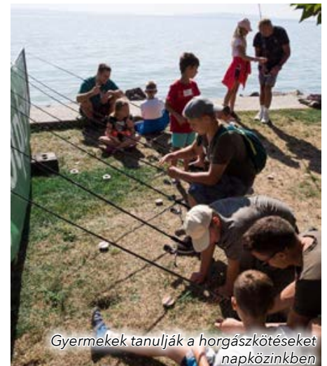
Gyermekek tanulják a horgászköteket napközinkben

A Balatonszepezdi Arany Horog Horgászegyesület gazdasági és pénzügyi helyzete stabil, amit a közösségi – tagtársaktól befolyt – finanszírozásán túl önkormányzati támogatásból