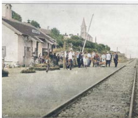
Szepezdi Fürdővendégek a vasúti megállónál.